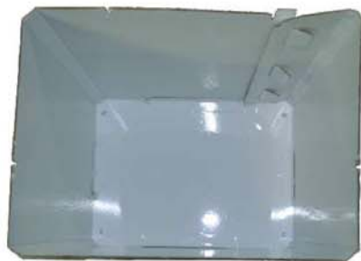
Vista superior de la gráfica inferior (no incluida)

2- Unir el cartón formando un cubo y colocarlo encima de la base metálica, una vez hecho, poner la primera balda y en cada lateral enganchar un soporte transparentes para balda.